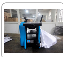
Sistema di aspirazione integrato (con sacchetto di recupero)