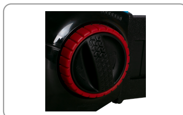
Blocage du guide et tendeur de chaîne.