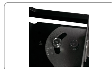
Mors arrière pivotant de -30° à +45°.