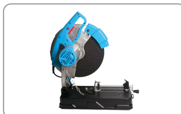
Grande poignée ergonomique en d.