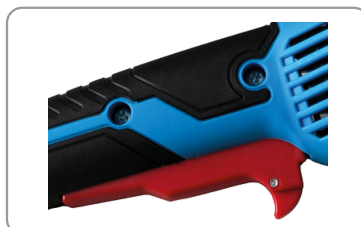
Gâchette de démarrage avec bouton de déverrouillage.