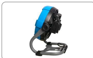
2 vitesses de ventilation réglables.