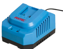
Chargeur rapide de batterie 20V Li-Ion