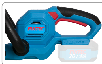
Poignée principale ergonomique avec revêtement caoutchouc.