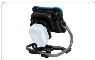
3 niveaux de luminosité 1100, 2000 et 2700 lm.