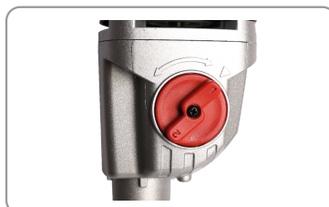
2 plages de vitesses mécaniques.