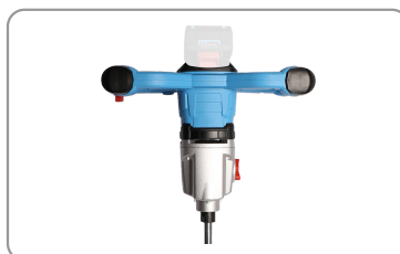
Poignées de préhension ergonomiques.