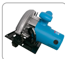
Angle de coupe réglable jusqu'à 45°.