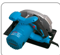
Poignées de préhension ergonomiques.