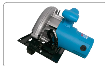
Angle de coupe réglable jusqu'à 45°.