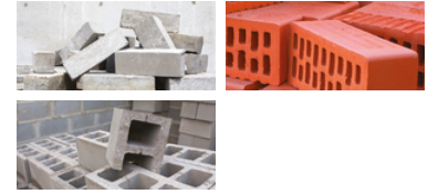
CALCESTRUZZO, BLOCCO, MATTONI PIENI