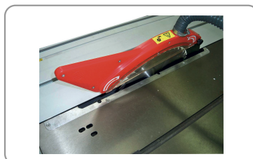
Carrello a filo lama da 2000 mm