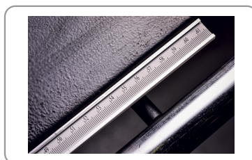
Guida di rifinitura con regolazione micrometrica