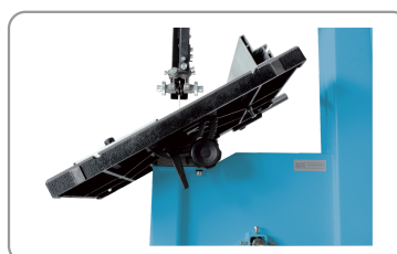
Banco inclinabile a 45°