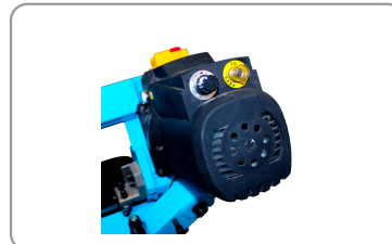
Variatore di velocità, pulsante di ripristino, spia di tensione