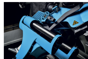
Testa a scorrimento radiale