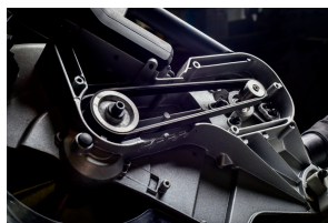
Trasmissione a cinghia