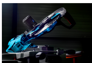
Testa inclinabile di 45° a destra e a sinistra