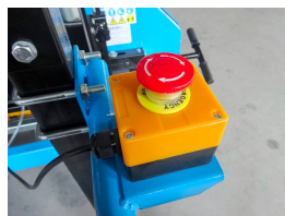
Pulsante di arresto di emergenza