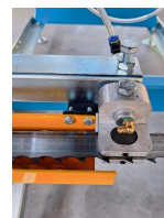
Guide de lame avec buse pour liquide de refroidissement