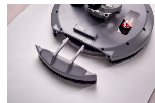
Parte amovibile del plattello per angoli