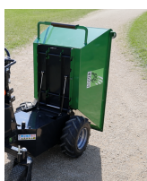
Benne à basculement manuel assisté par vérins à gaz