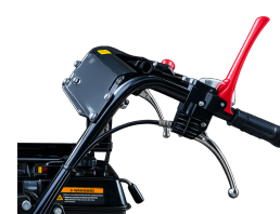
Poignée de sécurité "homme mort"