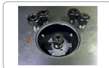
5 pinze di serraggio (6 - 6,35 - 8 - 12 - 12,7 mm)