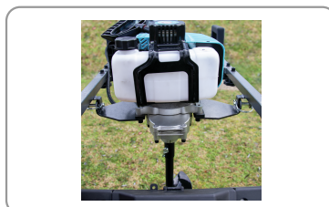
Montage du bloc moteur sur pivots