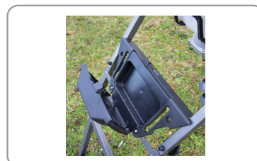
Boîtier de rangement des accessoires