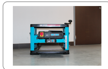
Banco di piallatura in acciaio zincato