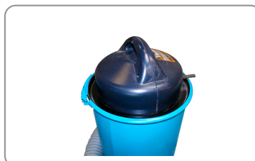
Maniglia per il trasporto