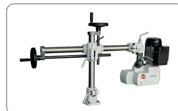
Braccio prolungato di 610 mm