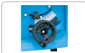
Lame réglable en hauteur par une manivelle.