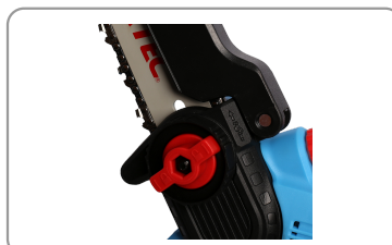
Changement de lame rapide et facile.