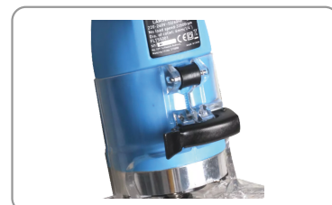
Butée de profondeur réglable.