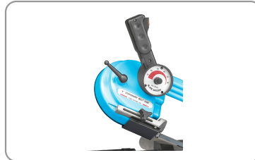
Variador de velocidad, palanca para un afloje y tensado rápido