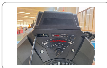
Moteur de 25 cv à démarrage électrique