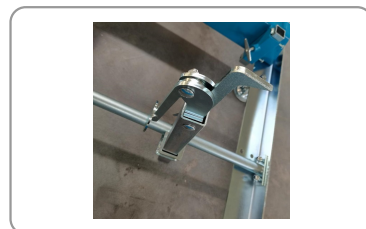
Griffe de maintien à serrage excentrique