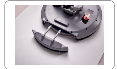
Parte extraíble para los ángulos