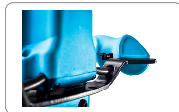
Regulador de velocidad electrónico