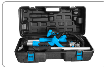
Livré avec une mallette de rangement