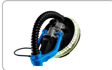
Iluminación led en el cabezal de pulido