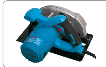
Poignées de préhension ergonomiques.