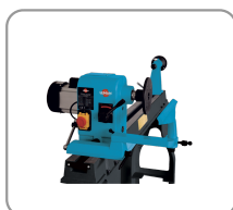
Rotación del cabezal hasta 180°