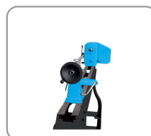
Cabezal fijo y móvil taladrado a 10 mm