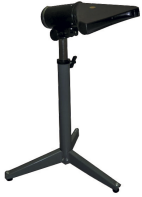
Boquilla de aspiración ajustable