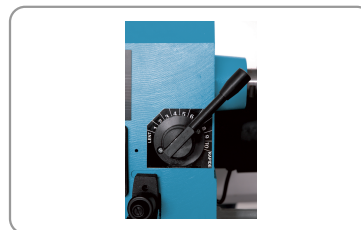
10 velocidades variables de 500 a 2000 rpm