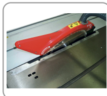
Carro junto a la hoja de 2000 mm