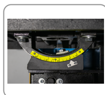
Mesa con inclinación de 30^\circ