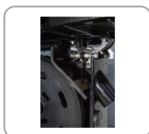
Guía de hoja superior e inferior con rodillos