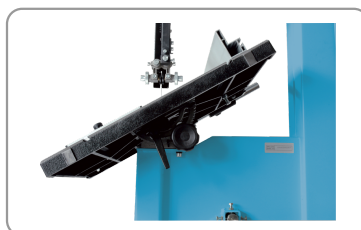
Mesa con inclinación de 45^\circ