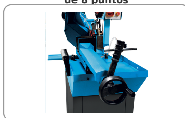
Mordaza de apriete rápido con palanca de ajuste del juego