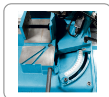
Arco orientable de 0° a 60° a la izquierda para los cortes angulados