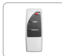
Mando a distancia