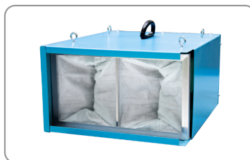
Interior de la máquina