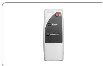
Mando a distancia