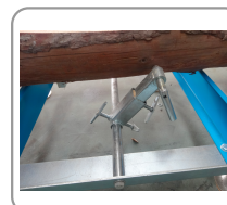
Sistema de retención de troncos