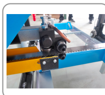
Guía y protector de la cuchilla ajustables