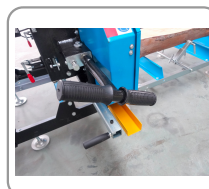
Mango de ajuste de la tensión de la cuchilla