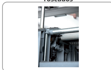
Contactor de seguridad