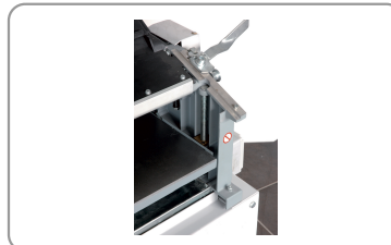
Mesa de cepillado de acero fundido sobre 4 cilindros roscados