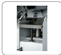
Mesa de cepillado montada sobre 2 ejes