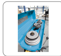
Poleas de acero