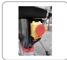
Botón pulsador de parada de emergencia