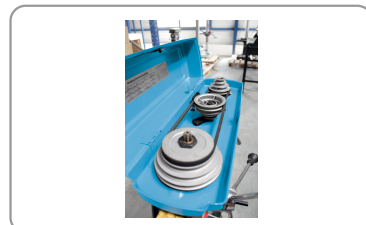
Poleas de acero