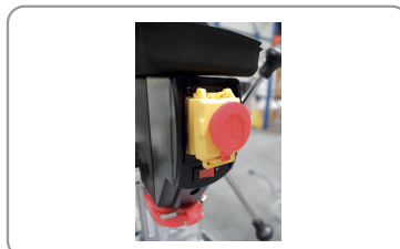
Botón pulsador de parada de emergencia