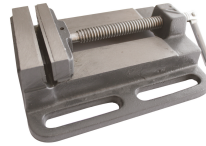
Mordaza con garras de 100 mm