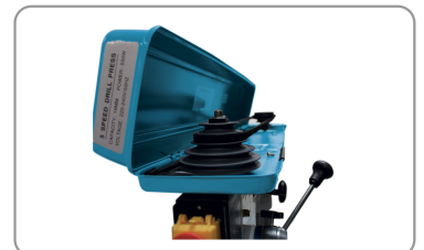
Poleas de aluminio