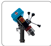
Cabezal giratorio y radial