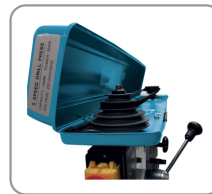
Poleas de aluminio