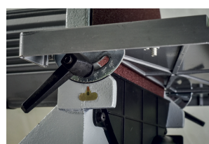
Mesa con inclinación de 45°