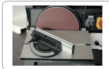
Guía de inglete