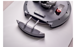
Parte extraíble para los ángulos