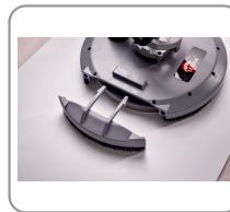
Parte extraíble para los ángulos