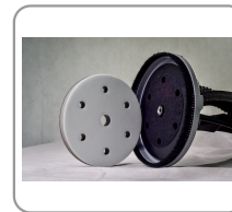
Fijación del disco sobre almohadilla de doble cara de velcro