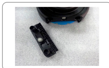
Cepillo de limpieza integrado