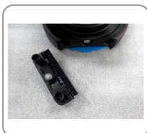
Cepillo de limpieza integrado