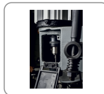
Sistema de mandril para fijación de la fresa