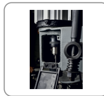
Sistema de mandril para fijación de la fresa