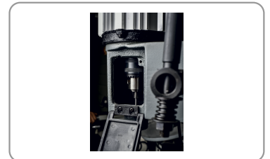
Sistema de mandril para fijación de la fresa